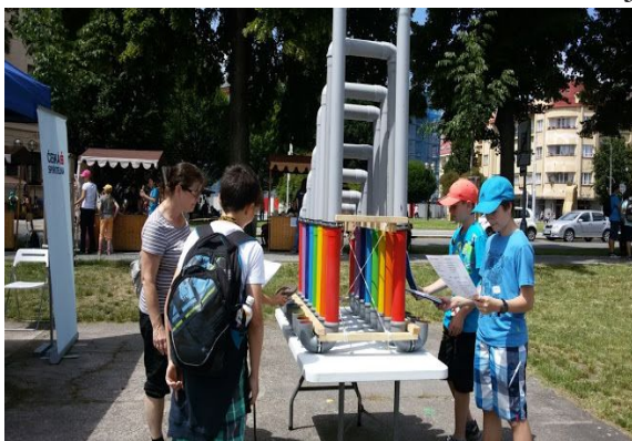
Hrajeme si hlavou

5) Hrajeme si hlavou - v červnu 2016 se naši žáci zúčastnili akce Hrajeme si hlavou, která probíhala na Tylově nábřeží. Děti se bavily nejen různými „poznávačkami“, ale někteří si na vlastní kůži vyzkoušeli např. „opilecké“ a „slepecké“ brýle. Podstoupily i jakousi zkoušku odvahy – účastnily se pokusů s CO 2 či elektřinou. Žáci si vyzkoušeli, jak se ovládají roboti, a také si zahráli na netradiční hudební nástroje.